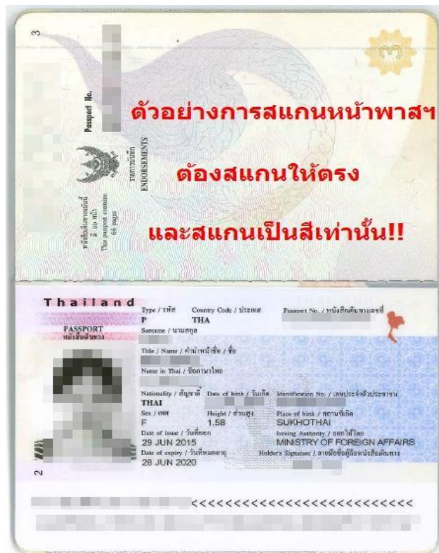
พาสปอร์ตต้องถ่ายให้ติดทั้ง 2 หน้า แบบตัวอย่าง